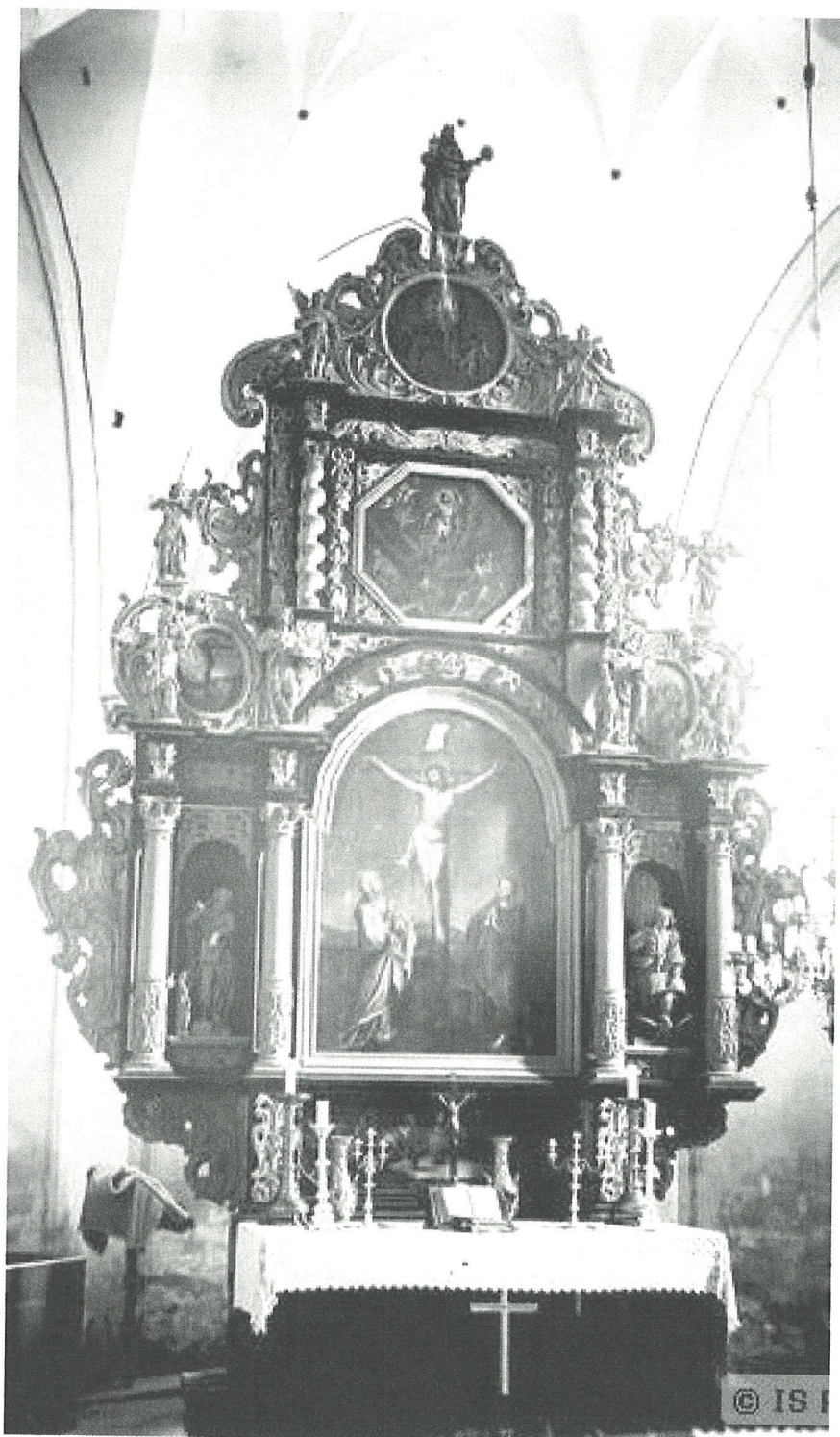
3. Kościół w Mariance. Archiwalna fotografia ukazująca ołtarz w latach 1904 – 1909.