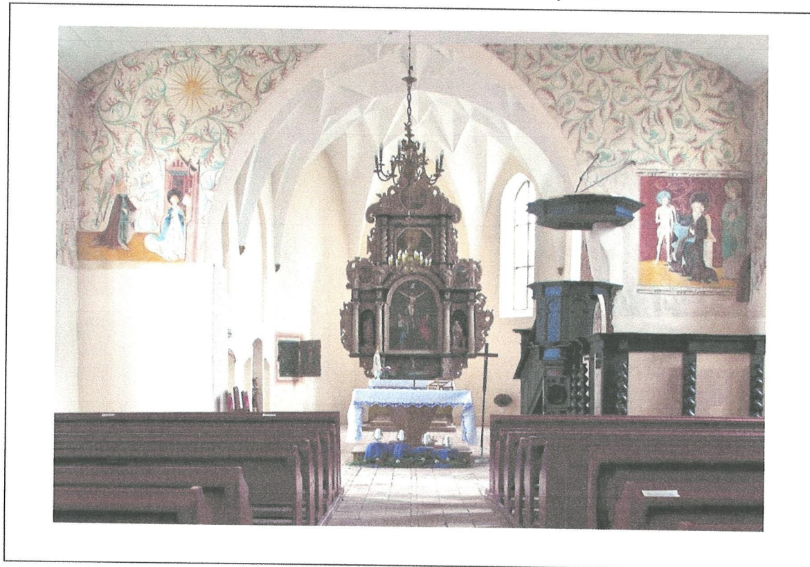
2. Kościół w Marianne, wewnątrz po zakończeniu prac przy elementach konstrukcyjnych ambony i baptysterium (2018) w głębi prezbiterium - ołtarz.