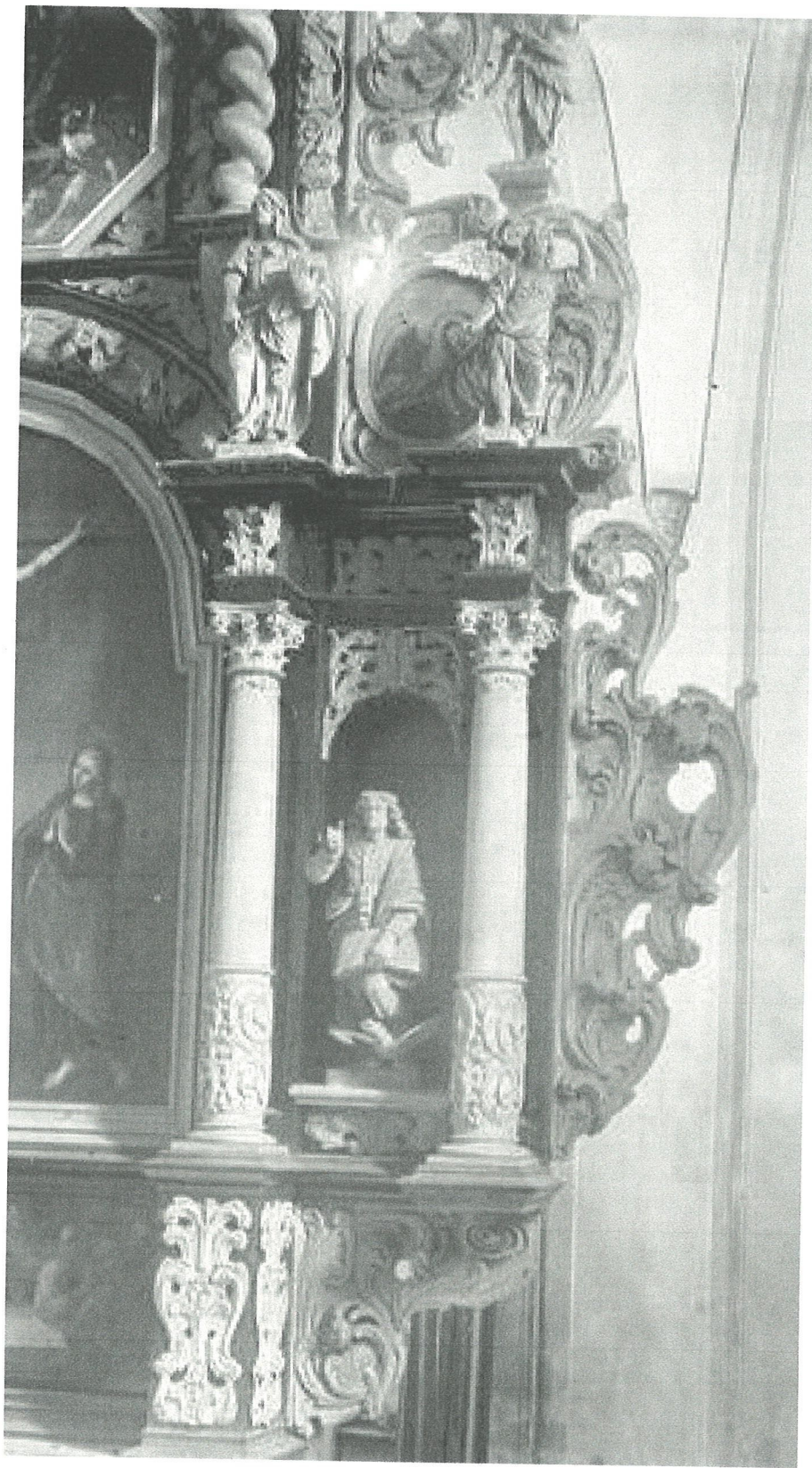
5. Kościół w Marianne. Archiwalna fotografia ukazująca ołtarz w latach 1904 – 1909. W niszy widoczna zaginiona figura św. Jana Ewangelisty.