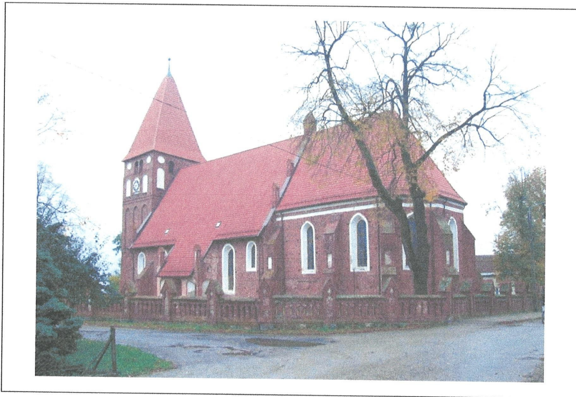
1. Kościół w Marianne, widok ogólny od PD-ZACH.