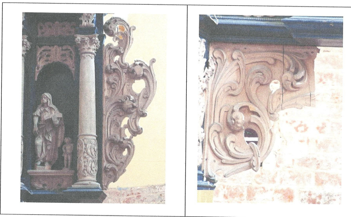
6. Kościół w Marianne. Ołtarz. Figura Ewangelisty z II kondygnacji ustawiona w miejscu zaginionej figury Św. Jana.