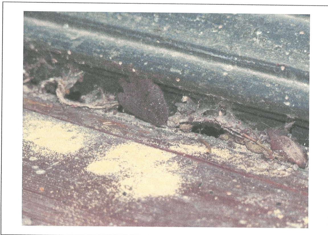
10. Kościół w Mariance. Ołtarz. Zniszczenia biologiczne odsłonięte po demontażu tabernakulum (stan w roku 2021).