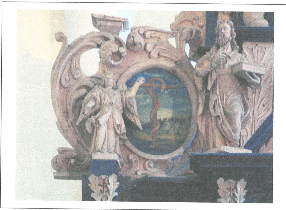
9. Kościół w Mariance. Ołtarz. II kondygnacja. Widoczny duży ubytek gzymsu i puste miejsce na konsolce powyżej obrazu (pierwotnie stała tam figura anioła).