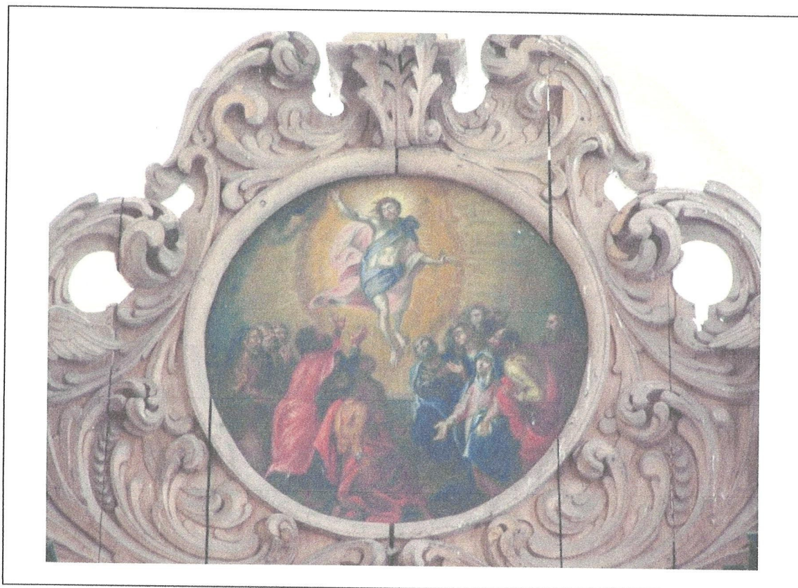
8. Kościół w Marianne. Ołtarz. Kartusz w zwieńczeniu nastawy. Widoczne spękania snyczerki.