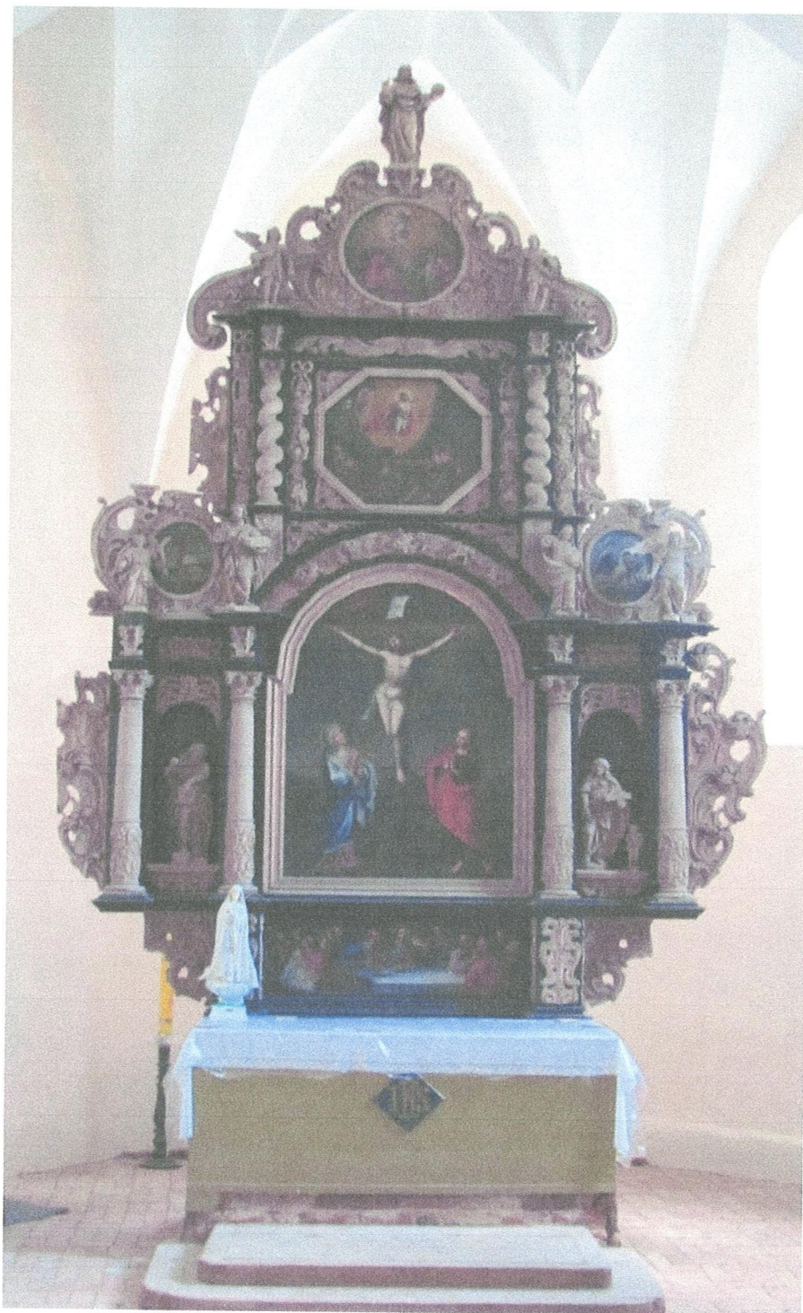
4. Kościół w Marianne. Ołtarz (stan w roku 2021).